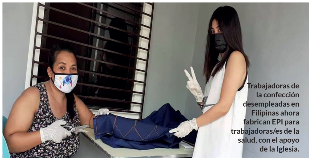
Trabajadoras de la confección desempleadas en Filipinas ahora fabrican EPI para trabajadoras/es de la salud, con el apoyo de la Iglesia.

Estos son solo algunos ejemplos de los cientos de respuestas creativas y positivas a medida que las iglesias se movilizan para ayudar a los más vulnerables en todo el mundo.