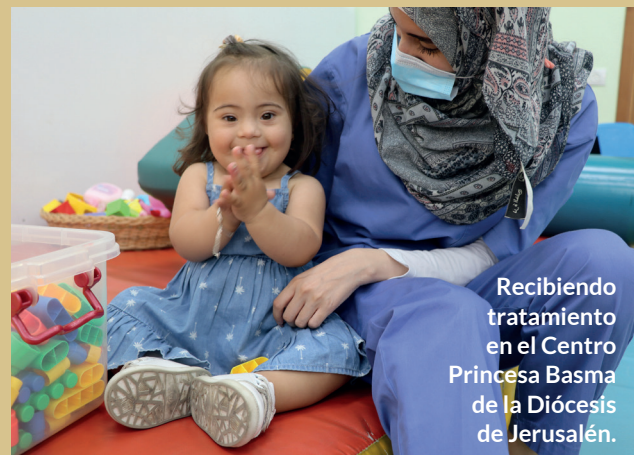
Recibiendo tratamiento en el Centro Princesa Basma de la Diócesis de Jerusalén.

Además del proceso con el grupo de teólogas/os, la Alianza Anglicana está comenzando a llevar esta serie de temas a otros contextos de la Comunión. Nos estamos poniendo en contacto con los foros regionales de la Alianza, las Redes de Comunión, grupos de jóvenes a jóvenes compañeros y otros, con la invitación a participar en la conversación de reflexión bíblica y cuestiones. La Alianza hará un seguimiento de estas conversaciones cuando sea posible para destilar las reflexiones en todo el mundo. Ofreceremos esto como una contribución a las reflexiones de la Comunión sobre lo que significa crecer plenamente en la Iglesia de Dios para el Mundo de Dios.