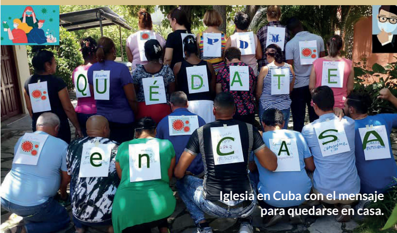
Iglesia en Cuba con el mensaje para quedarse en casa.