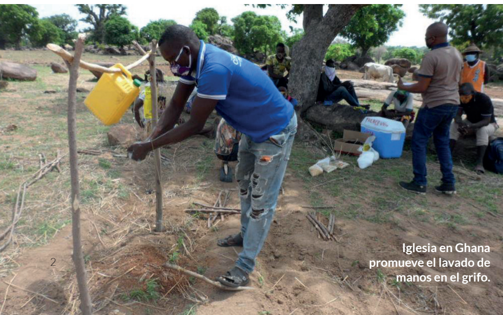
Iglesia en Ghana promueve el lavado de manos en el grifo.