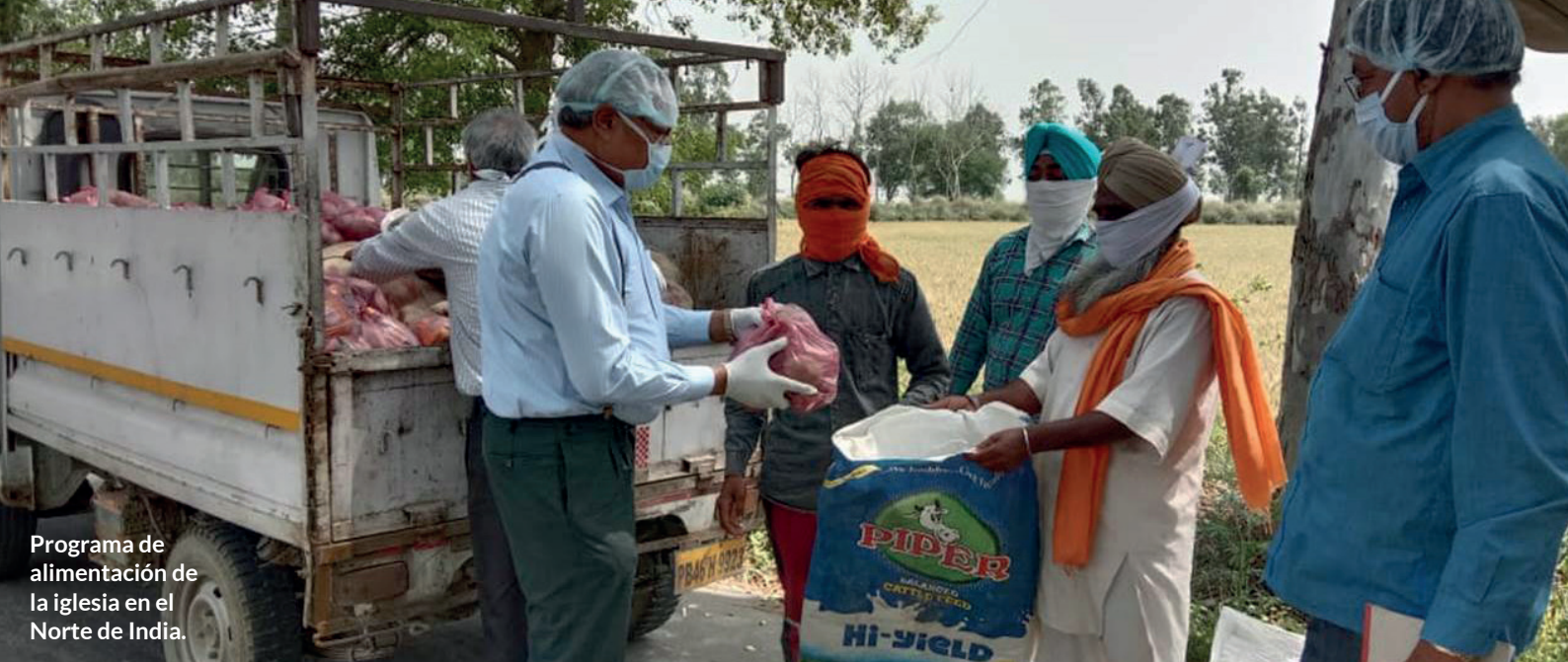
Programa de alimentación de la iglesia en el Norte de India.

migrantes, lo que las/os pone en mayor riesgo de infección. En algunos países, estas/os trabajadoras/es migrantes perdieron sus trabajos y se quedaron abandonadas/os sin un centavo en un país extranjero. En algunos lugares, las iglesias temen que las/os migrantes sean estigmatizadas/os y acusadas/os de propagar el virus. En muchas partes de la Comunión, las iglesias han apoyado a las/os trabajadoras/es migrantes afectados y han defendido un trato digno. La Diócesis de Singapur ha lanzado varias iniciativas para apoyar a las/os trabajadoras/es migrantes y promover la valorización de su papel. Esto incluye un proyecto de medios innovador, llamado 'Mi Dormitorio, Nuestra Casa', para ayudar a desarrollar la resiliencia de los trabajadores migrantes. El contenido divertido y educativo se elaboró en tres idiomas en colaboración con la Iglesia de Bangladesh y otros.